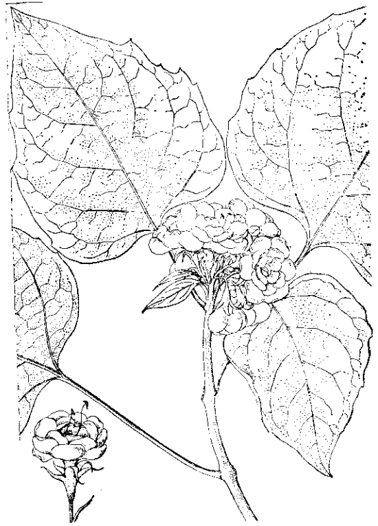
图 91 重瓣臭茉莉 Clerodendrum philippinum Schauer var. philippinum (蒋杏墙绘)

Clerodendrum philippinum Schauer in DC. Prodr. 11: 666. 1847; Howard et Powell in Taxon 17 (1): 53—55. 1968; 云南植物志 1: 470. 图版 112, 3—6. 1977. — Volkmania japonica auct. non Thunb.; Jacq. Hort. Schoenbs. 3: 48. t. 338. 1798. — Volkmaria fragrans Vent. Jard. Malm. 2: t. 70. 1804. — Clerodendron fragrans Hort. ex Vent. Jard. Malm. 2: t. 70. 1804. in syn.; P'ei in Mem. Sci. Soc. China 1 (3): 137. 1932; pro parte quoad “cultivated form”; 陈嵘, 中国树木分类学 1099. 1937. 一部分, 包括图 986. — Clerodendron fragrans var. multiplex Sweet. Hort. Brit. 322. 1827. — Clerodendron fragrans var. pleniflora Schauer in DC. Prodr. 11: 666. 1847; P. Dop in Lecomte, Fl. Gen. L'Indo-Chine 4: 858. 1935; 中国高等植物图鉴 3: 600. 1974. — Clerodendron japonicum (Thunb.) Sweet var. pleniflorum (Schauer) Maheshw. in Taxon 15: 43. 1966.