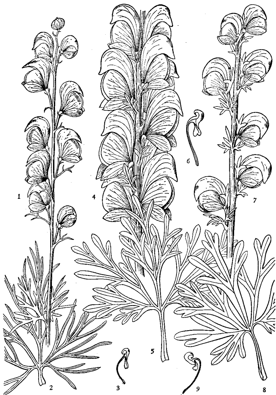
1—3 多裂乌头 Aconitum polyschistum 1.花序; 2.茎生叶; 3.花瓣。4—6. 短柄乌头 A. brachypodum 4.花序; 5.茎生叶; 6.花瓣。7—9 缩梗乌头 A. sessiliflorum 7.部分花序; 8.茎生叶; 9.花瓣。(均为原大)(王金凤绘)