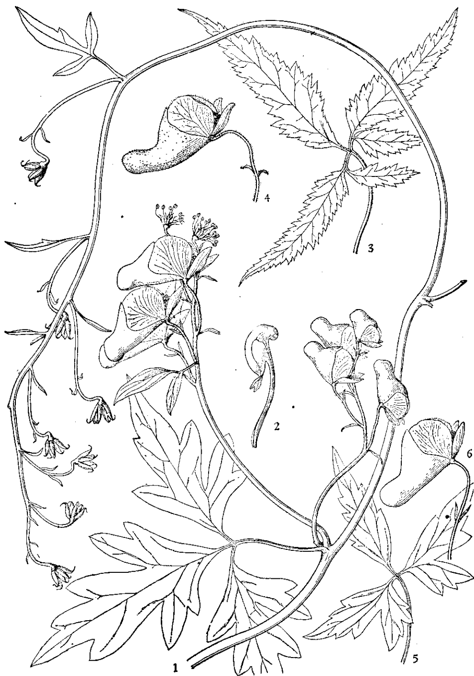
1—2. 松潘乌头 Aconitum sungpanense 1. 植株上部; 2. 花瓣。3—4. 大麻叶乌头 A. cannabifolium 3. 基生叶; 4. 花。5—6. 川鄂乌头 A. henryi 5. 基生叶; 6. 花。(冯晋庸绘)