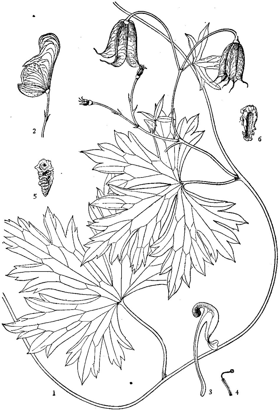
滇南乌头 Aconitum austroyunnanense 1.部分植株; 2.花;3.花瓣;4.雄蕊;5,6.种子。(王金凤绘)