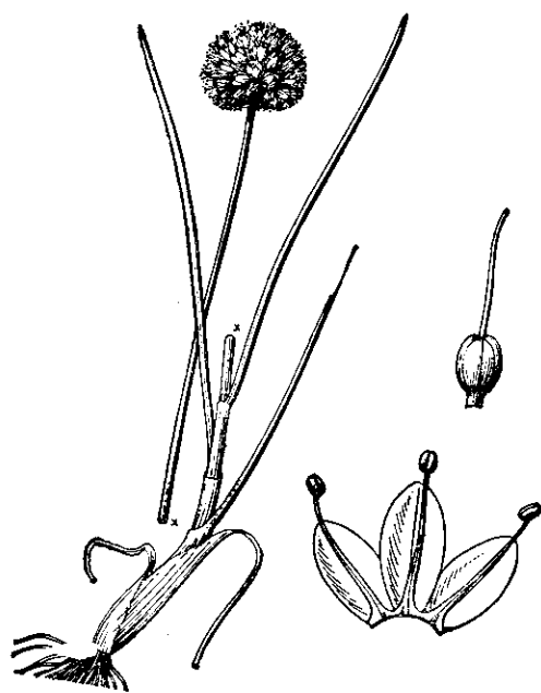
图78 野葱 Allium chrysanthum Regel (冀朝楨绘)