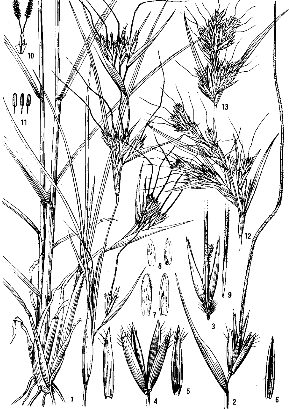
图版 63 1—11. 黄背草 Themeda japonica (Willd.) Tanaka: 1. 植株, 2. 具佛焰苞的总状花序, 3. 总状花序最上 3 小穗, 4. 总苞状小穗, 5. 总苞状小穗的第一颖背、腹面, 6. 总苞状小穗的第二颖腹面, 7—9. 无柄小穗: 7. 第一外稃背、腹面, 8. 第一内稃背、腹面, 9. 第二外稃及芒部分, 10. 鳞被及雌蕊, 11. 雄蕊. 12. 元谋菅 Th. yuanmounensis S. L. Chen et T. D. Zhuang: 伪圆锥花序部分. 13. 中华菅 Th. chinensis (A. Camus) S. L. Chen et T. D. Zhuang: 伪圆锥花序部分.